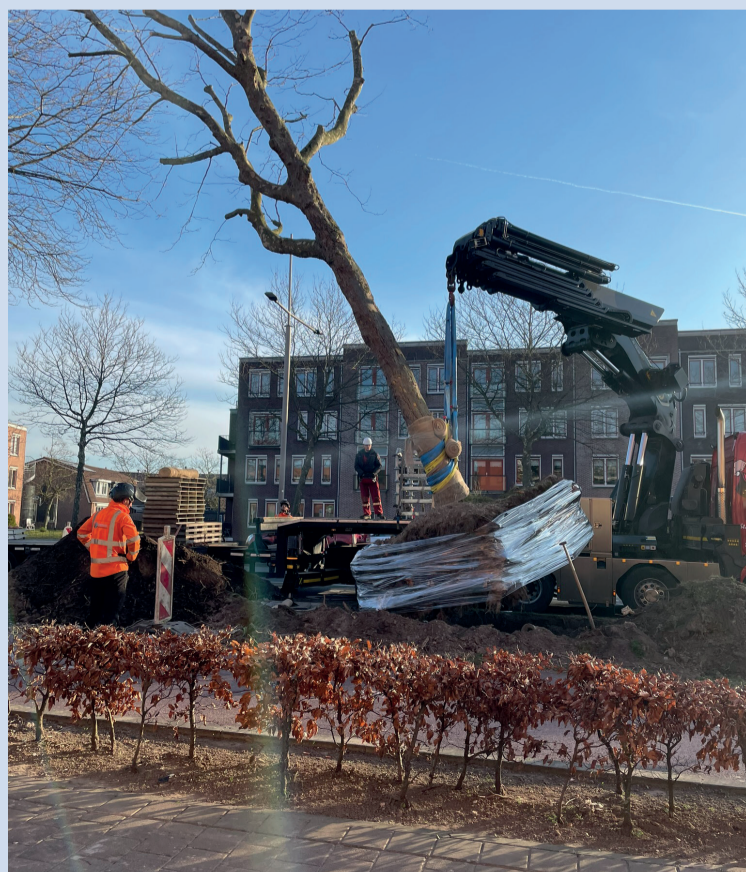
■ Om de Laan van Welhorst deze zomer veiliger te kunnen maken, zijn onlangs enkele bomen daar weggehaald. Als het werk klaar is, krijgen deze bomen een nieuwe, vaste plek aan de Laan van Welhorst.

Heeft u vragen over het verplaatsen van de bomen of een andere vraag over de Laan van Welhorst? Dan kunt u deze stellen via het reactieformulier op onzeopenbareruimte.nl/laan-van-welhorst , ook te bereiken via de QR-code.