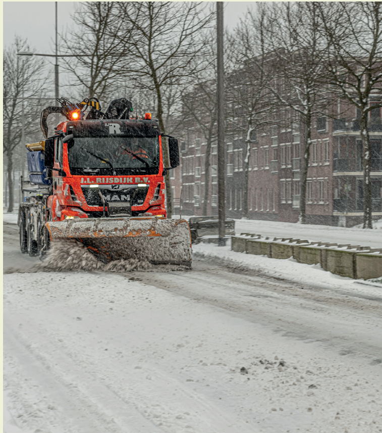
Ambachtse gladheidsbestrijders in actie, 2021.

De Ambachtse strooiroutes en meer informatie vindt u onder h-i-ambacht.nl/glad .