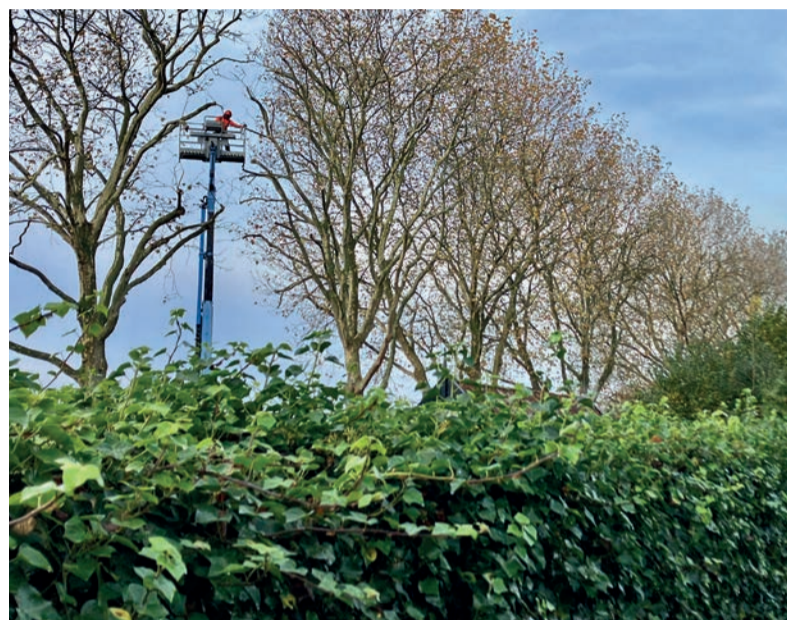
■ Ondanks de kou werd aan de Onderdijk hard gewerkt: de monumentale platanen kregen een snoeibeurt. Hierbij werd meteen gecontroleerd hoe de bomen er aan toe zijn, zodat we nog lang van deze bomen kunnen genieten.