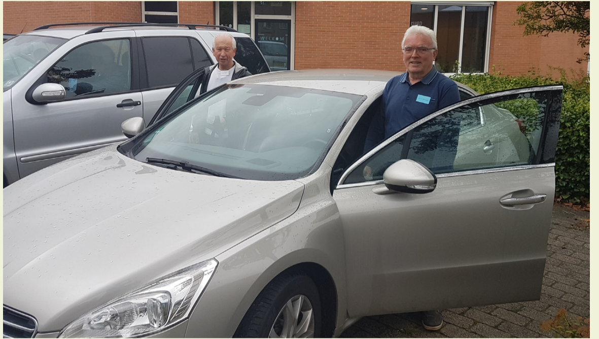
■ Deelnemers maken samen met een speciaal opgeleide ritbegeleider een rijvaardigheidsrit in de eigen auto.

0184-685317 (Mevrouw L. de Jong achterlaten. Na aanmelding ontvangt u een bevestigingsbrief. Bij geen gehoor kunt u een boodschap