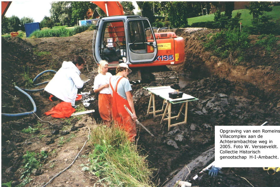
Opgraving van een Romeins Villacomplex aan de Achterambachtse weg in 2005.

Deze nota geeft samen met de gemeentelijke archeologische beleidskaart concreet aan wanneer een archeologisch onderzoek in het kader van een bestemmingsplan- of omgevingsvergunningprocedure noodzakelijk is. Daarmee zorgt deze nota ervoor dat het voor burgers en bedrijven duidelijk is wanneer zij een archeologisch onderzoek moeten (laten) uitvoeren. Zij kunnen dan tijdens planvorming rekening houden met archeologie. Wanneer in een vroegtijdig stadium duidelijkheid bestaat over de aanwezigheid van archeologie in de bodem, kunnen onverwachte situaties tijdens de uitvoering van ruimtelijke plannen grotendeels worden voorkomen.