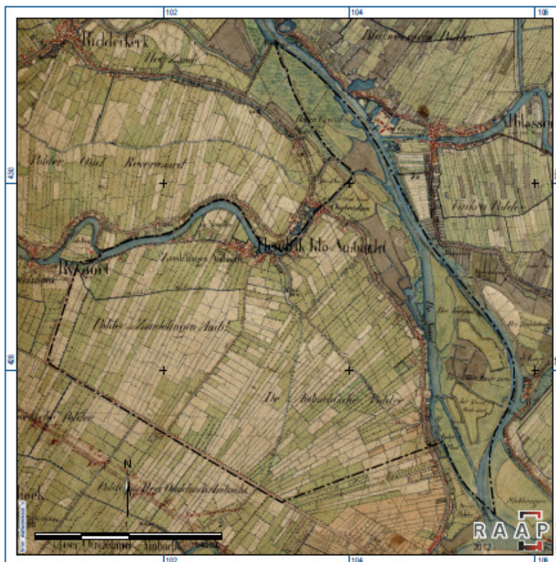
De gemeente Hendrik-Ido-Ambacht op de veldminuut (circa 1850). De afzonderlijke opwassen in de Noord/Pelsert/Rietbaan zijn al grotendeels aangegroeid

De Monw geeft aan dat bij projecten kleiner dan 100 m 2 geen archeologisch onderzoek is vereist. De gemeenteraad heeft de bevoegdheid om een andere grens vast te stellen (art. 41a MW).