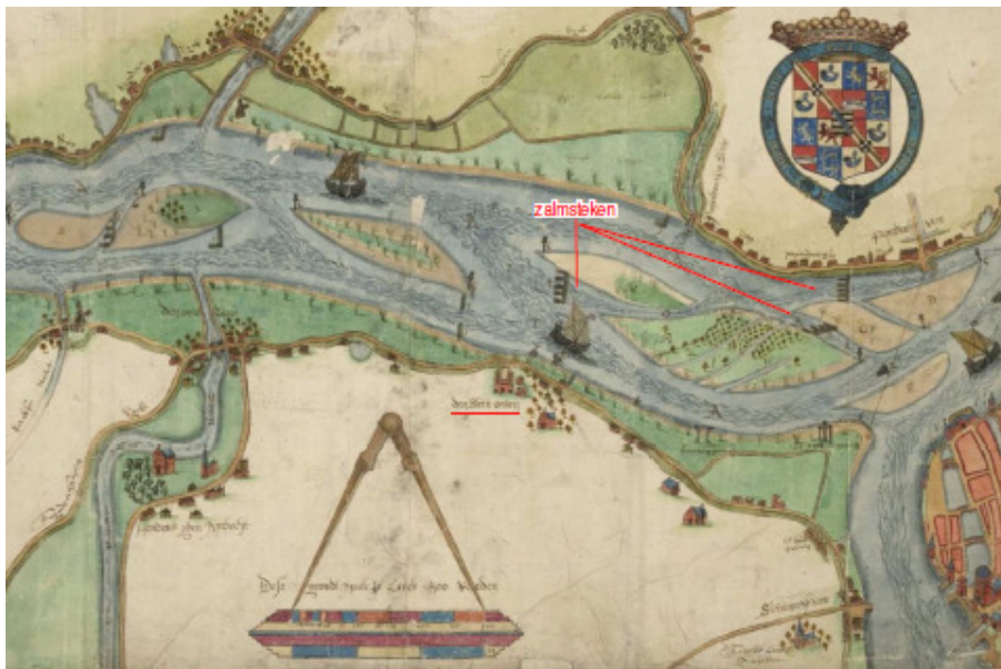
Details van de door Mattijs Jansz Been vervaardigde kaart uit 1615. Weergegeven is de oude steenplaats ('den steen ooven') net ten noordoosten van het 'huis met zadeldak' (Vredenburg?). Verder zijn de opwassen en de zalmsteken in de Noord goed te zien (N.B. het noorden is links).

Een 'selectiebesluit' kan in sommige gevallen verstrekkende gevolgen hebben omdat de aanvrager wordt geconfronteerd met extra kosten door: aanvullend onderzoek, de aanpassing van zijn (bouw)plannen of een opgraving. Wanneer de aanvrager hier tegen wil ageren, zal hij hiervoor de (reguliere) rechtsmiddelen moeten gebruiken, zoals het indienen van een zienswijze of het aanspannen van een bezwaar- en beroepsprocedure naar aanleiding van het besluit op zijn aanvraag. Ook is het mogelijk dat een derde belanghebbende van deze rechtsmiddelen gebruik maakt, bijvoorbeeld wanneer deze belanghebbende van mening is dat archeologie onvoldoende is betrokken in de besluitvorming.