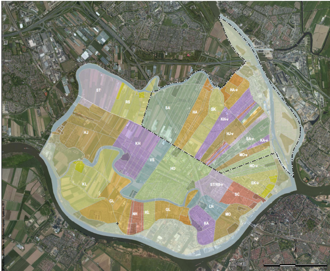
Foto: De oorspronkelijke 14 e eeuwse hoevenverkaveling van de zwindrechtse Waard in ambachten en volgerlanden geprojecteerd op een recente luchtfoto